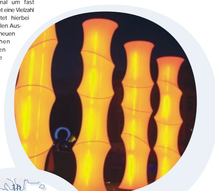
„Mit Licht Räume gestalten“ ein Projekt der FH Coburg, Designforum Oberfranken

An Kreativität und Innovation mangelt es in Oberfranken nicht. Viele Dienstleister haben hier bereits ihren Mut zum Neuen gezeigt, sind ausgebrochen aus dem Althergebrachten und haben dadurch neue Marktpotenziale effektiv genutzt.